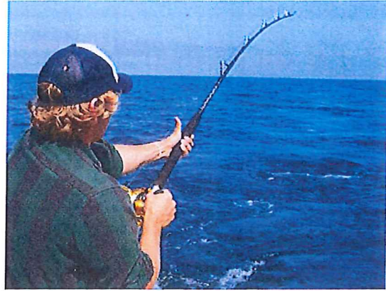
Man får fiska