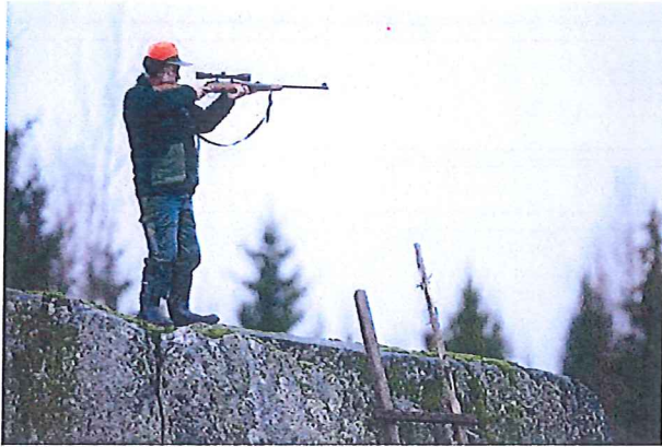
Förbjudet att jaga

Du får fiska med fiskespö i Vänern, Vättern, mälaren, Hjälmarens och Storsjön.