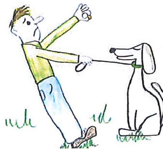
Hund med koppel